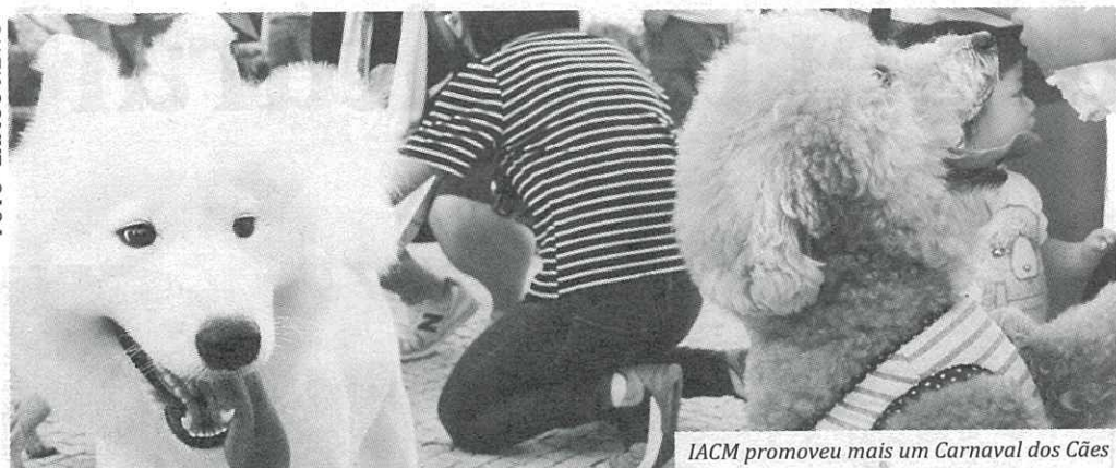
IACM promoveu mais um Carnaval dos Cães